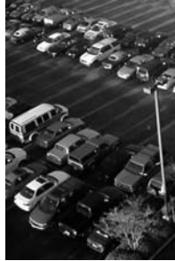
3. Autó parkolók