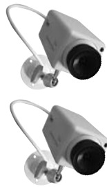
7. Szereljen egyaránt álca és valódi kamerákat.