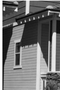
8. Eresz alá

Biztonsági megoldások teljes skálája: www.swannsecurity.com